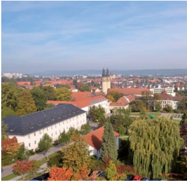
Vituskirche auf dem Gelände des Bezirksklinikum Regensburg