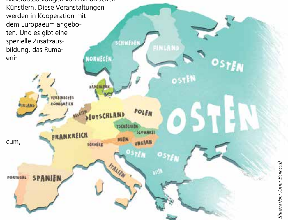
Illustration: Anna Benzedi

Wie gesagt, ich habe während meines Aufenthalts auch Rumänen getroffen, die schon relativ lange in Regensburg lebten.