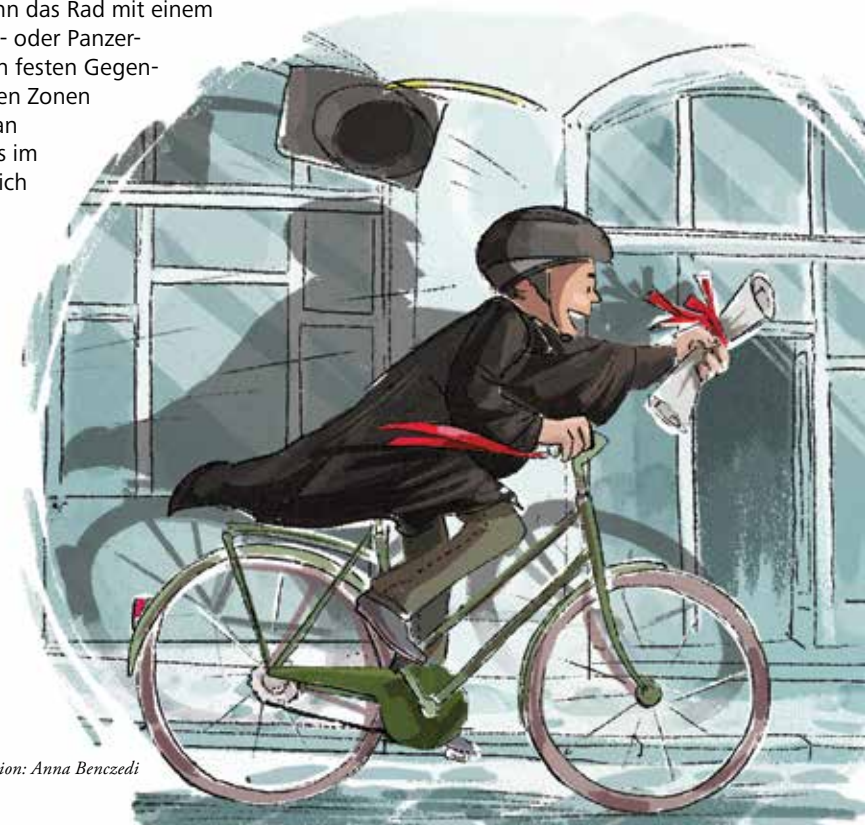
Illustration: Anna Benczedi

In Regensburg wurden im Jahr 2012 insgesamt 269 Unfälle mit Radverkehrsbeteiligung von der Regensburger Polizei aufgenommen. Davon waren 237 Unfälle mit verletzten Personen. In den letzten Jahren sind die Unfallzahlen gesunken, wobei schwere Personennunfälle seit 2006 einen leichten Rückgang verzeichnen. Die Unfallursachen können vielseitig sein, sagte uns der Polizeihauptkommissar, Herr Hirsch. Das linksseitige Radfahren (52%) ist in Regensburg die Hauptunfallursache. Die sogenannten Geisterradler werden deswegen mit Verwarngeld gestraft. Die anderen Ursachen beschränken sich hauptsächlich auf Fehler beim Rechtsabbiegen (10%), Nichtbeachtung der Vorfahrt (8%), Alkohol (10%), usw.