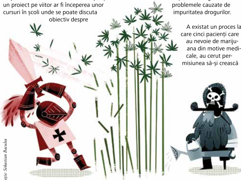
Ilustrație: Sebastian Baculea

A existat un proces la care cinci pacienți care au nevoie de marijuana din motive medicale, au cerut permisiunea să-și crească