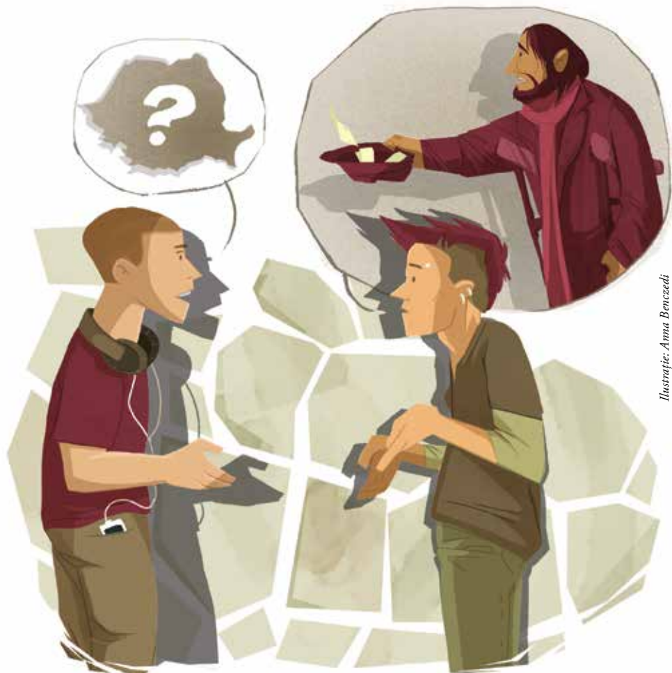
Illustrație: Anna Benczedi

Așa se întâmplă, că România și românii rămân pentru mulți oameni un semn de întrebare cu conotație negativă și neagră, iar în cercuri academice, în cadrul Centrului Europaeum și al Institutului de Limbi Romanice se încearcă să se lumineze acest întuneric, având ca rezultat, o imagine puternic variată a României.