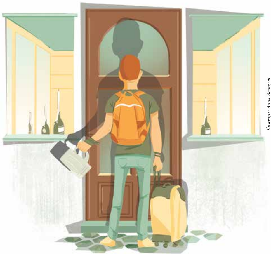
Illustrație: Anna Benzecedi

membrii activi și cei care au o anumită vechime, care au deja o carieră.