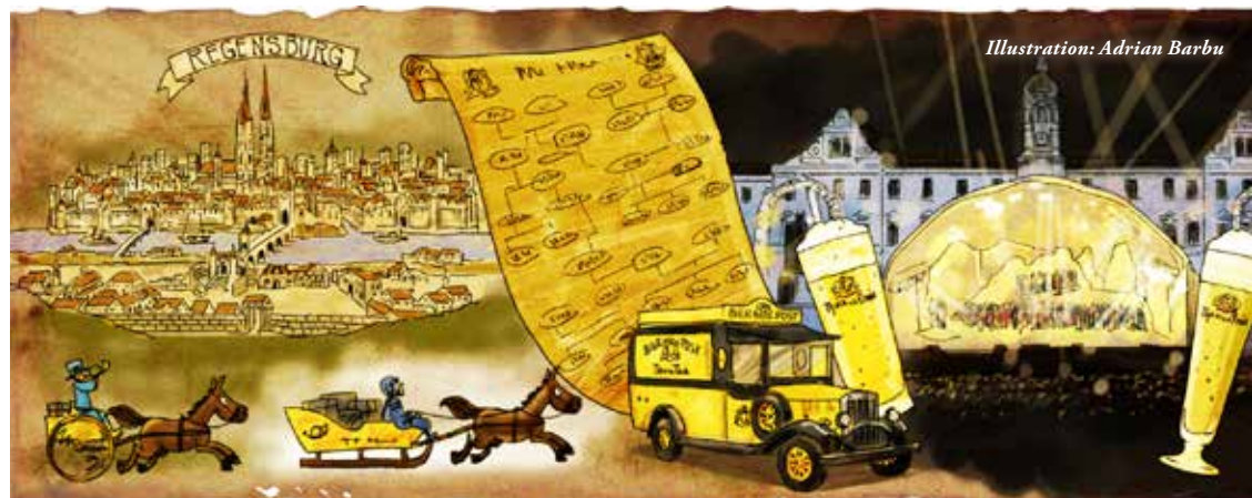
Illustration: Adrian Barbu

Fürstin Gloria führt ein ganz normales Leben. Obwohl sie sich ganz normal anzieht und kleidet, sind ihre Freundinnen vor allem Adlige. Sie wird auch heutzutage mit „Ihre Durchlaucht” 2 angesprochen.