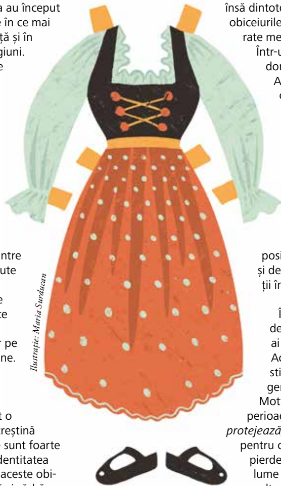
Ilustrație: Maria Surducan

După anul 1945 totul este reorganizat. „Conservarea modernă a tradițiilor popu-