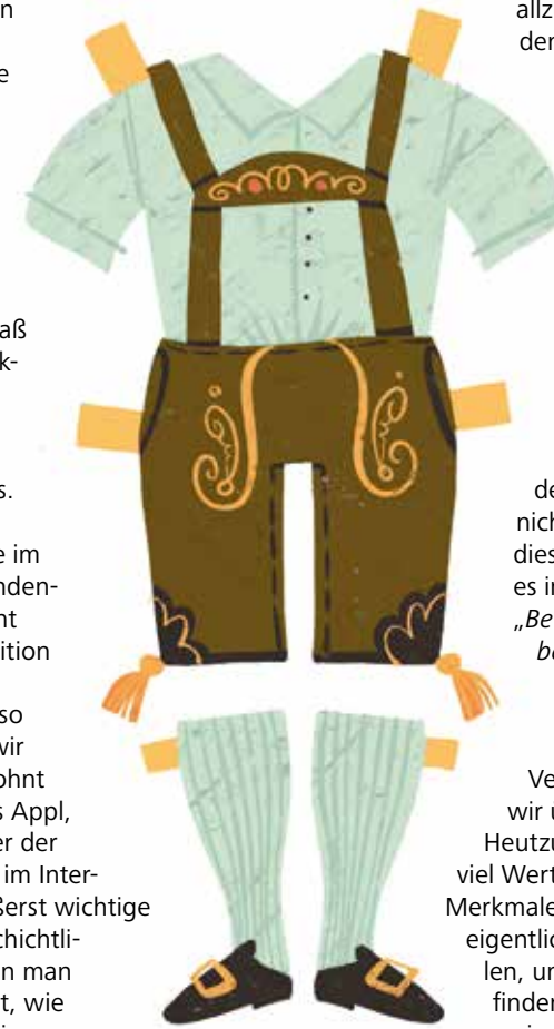
Illustration: Maria Surducan

Nach 1945 wird alles reorganisiert. „Moderne Heimatpflege ohne Auseinandersetzung mit dem Dritten Reich geht nicht“, so Dr. Appl. In dieser Zeitspanne ging es im Wesentlichen um „Bewahren, bewahren, bewahren“. Was aber die moderne Heimatpflege angeht und auch deren Umgang mit der Vergangenheit, reden wir über eine 180°-Wende. Heutzutage legt man sehr viel Wert auf identitätsstiftende Merkmale, auf die Sachen, die die eigentlichen Rahmen darstellen, um eine eigene Identität finden, akzeptieren und verinnerlichen zu können. In diesem Sinne ist die Hauptaufgabe des Bezirksheimatpflegers das konstante Überprüfen der Reaktion der modernen Gesellschaft gegenüber Traditionen und die ständige Entwicklung von Methoden und Strategien, um die Gesellschaft mit ihrem Heimatbewusst-