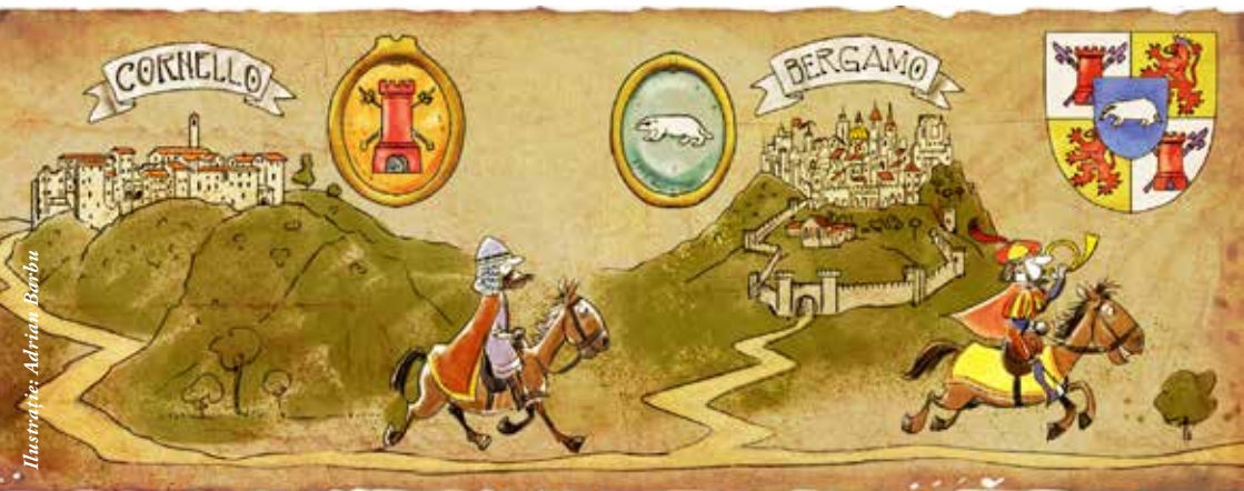
Familia Thurn și Taxis

În apropierea centrului istoric al orașului Regensburg se află cel mai mare castel locuit al Europei. Clădirea îi aparține familiei Thurn și Taxis, iar prințesa Gloria locuiește acolo și astăzi.